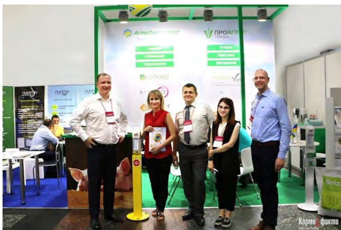
АгроПлюсІнвест: працюємо на випередження основних тенденцій ринку

З огляду на це питання саме Міжнародний конгрес «Прибуткове свинарство» спрямовує свою роботу як на інформаційне забезпечення, так і на обмін передовим досвідом в галузі прибуткового свинарства. Змінюємо світ на краще та йдемо до успіху разом!