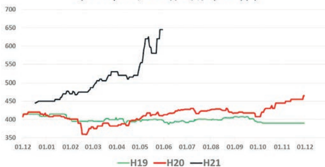
Ціни на ріпак, СРТ-Одеса, $/т (без ПДВ)

Новий сезон буде цікавим. По-перше, у липні-серпні з України буде відвантажено більше 100 тис. т ріпаку в Канаду. Канада – найбільший у світі виробник та експортер ріпаку. По-друге, у поточному сезоні Україна імпортувала партію австралійського ріпаку для переробки на внутрішньому ринку. Також, як відомо, торговельне вікно по ріпаку коротке, всього два-три місяці. Тому для більшості виробників ріпак – це “швидкі гроші”. Скоріше за все, більшість аграріїв будуть продавати ріпак, що спричинить його високу пропозицію на ринку та може незначно знизити ціну. Але враховуючи, що більшість трейдерів низько оцінюють виробництво олійної, близько 1,9-2,1 млн т (у минулому році виробництво було 2,4 млн т), тому очікувати різкого зниження не варто.