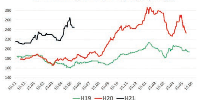
Ціни на пшеницю 3-го кл, СРТ-Одеса, $/т (без ПДВ)

У поточному році плани по “друкуванню” грошей ще амбітніші. Тому можна очікувати, що ціни на пшеницю будуть вищі, ніж у сезоні 2020/21. Можливо, варто розглянути довгострокову стратегію щодо пшениці та не поспішати продавати її всю в період липень-серпень, а замінити її частину на ріпак або ячмінь.