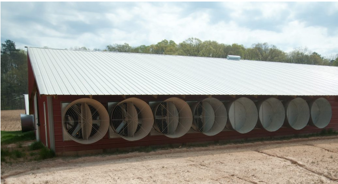
Фото 3. Тунельні вентилятори, розміщені на бічній стіні, починаючи з торцевої стіни

до торцевих стін. Якщо використовуються випарні касети (пед-кулінг), рекомендується, щоб їх висота була наближена до висоти стіни, до якої вони кріпляться (тобто в пташнику з касетами, висотою 1,83 м, швидкість руху повітря буде швидше, ніж в пташнику з касетами висотою 1,52 м, фото 1 і 2).