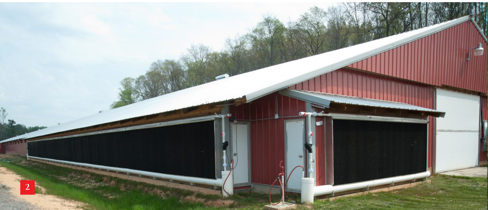
Фото 1. Випарні касети, висотою 1,83 м

Наприклад, швидкість повітря в пташнику з тунельною вентиляцією завжди буде нижче біля передньої торцевої стіни, а також в кінці пташника, близько торцевої стіни, на якій знаходяться тунельні вентилятори. Швидкість руху повітря біля передньої торцевої стіни можна максимізувати, переконавшись, що припливні жалюзі або тунельні стулки встановлені на самій торцевій стіні і також на бічних стінах, якомога близько