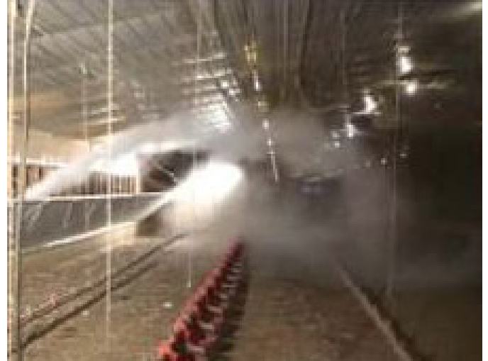
Фото 7, 8. Повітря, що надходить через тунельні стулки, рухається уздовж стелі, а потім – по колу назад, до бічної стіни, вже на рівні підлоги