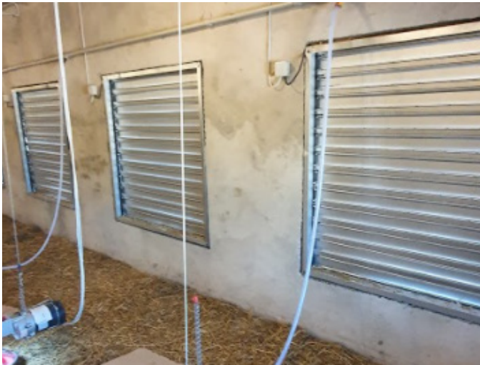
Фото 5. Припливні жалюзі