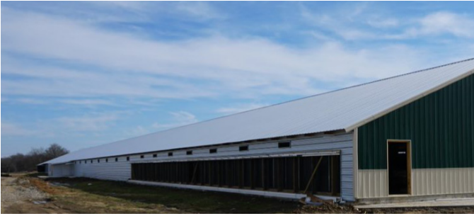
Фото 2. Випарні касети, висотою 1,52 м