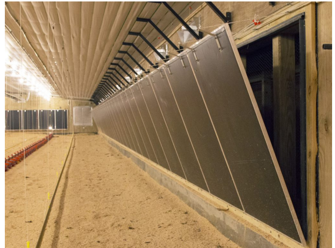
Фото 6. Тунельні стулки

Дослідження проводилося в двох пташниках, розміром 20 × 152 м. Два корпуси були ідентичні, за винятком того, що один був обладнаний припливними жалюзі (фото 5), а другий – тунельними стулками (фото 6). У кожному з приміщень було встановлено 16 тунельних вентиляторів розміром 1,38 м по 1,12 кВт та 2 тунельні вентилятори розміром 1,22 м по 1,12 кВт. Всі вентилятори були оснащені конусами для збільшення продуктивності і клапанами «метелик». У передній частині пташника на торцевій стіні було встановлено 8 м випарних касет висотою 1,52 м і по 35 м касет на кожній бічній стіні приміщення.