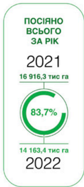
Аналіз проведений згідно з даними опитування Міністерства аграрної політики та продовольства України в 2022 році.