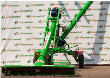
Навантажувачі зерна НЗ-5 / НЗ-25 / НЗ-60

ТДВ «Львівагромашпроект» – одна з провідних компаній-виробників техніки та обладнання для захисту рослин. Асортимент компанії занадто великий, щоб в одному номері розповісти про все, що виробляє це вітчизняне підприємство. У попередніх номерах журналу ми вам показали найкращі розробки причіпних обприскувачів та протруювачів ТДВ «Львівагромашпроект». Сьогодні ви ознайомитесь з іншою технікою, яка вкрай необхідна нашому сільгоспвиробникові. Це Навантажувачі зерна, Дезінфекційні установки, Змішувач препаратів, Установка для вакцинації УВ-50.