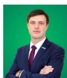
Тарас Висоцький, заступник міністра економіки, розвитку та сільського господарства України