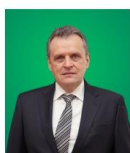
Леонід Козаченко, президент Української аграрної конфедерації