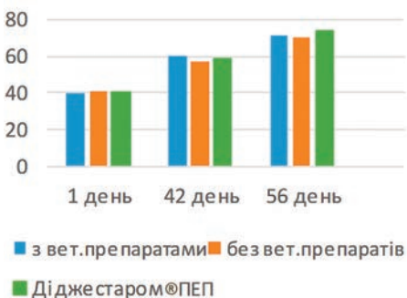
Рис. 1. Вага молодих тварин, кг

«Коли патогенні мікроорганізми, ендотоксини та мікотоксини – під контролем, саме час подбати про потенціал теличок», – зауважила експерт та презентувала слухачам семінару натуральний стимулятор росту Діджестаром®ПЕП. Лише 250 г/т готового корму значно оптимізує базові показники: вагу тварин, конверсію корму та споживання сухої речовини (див. рисунки 1, 2, 3).