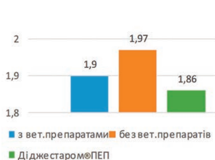
Рис. 2. Конверсія корму