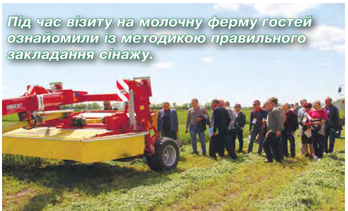
Під час візиту на молочну ферму гостей ознайомили із методикою правильного закладання сінажу.

Молоко – це, з певною долею спрощення, розчин лактози, молочного білку та молочного жиру. Основним джерелом лактози є крохмаль. Найкращим джерелом крохмалю є кукурудзяний силос. Джерелом молочного білку є протеїн. Ніщо не зрівняється з люцерною за вмістом протеїну. В молочного жиру є два джерела – жир рослинний та перетравна клітковина. З рослинними жирами потрібно працювати обережно, його надмірна кількість (більше 3% раціону по СР) навпаки стримуватиме утворення молочного жиру.